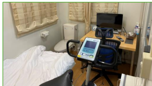
図 仙台大学ヒューマンカロリメーター

ヒューマンカロリメーターでは、マスクをつけずにエネルギー代謝が測定できますので、食事中や睡眠中、運動やe-sports中など様々な条件での測定が可能です。また、宿泊を伴うような長時間の測定も可能ですから、滞在中に使ったエネルギー代謝も測定できます。