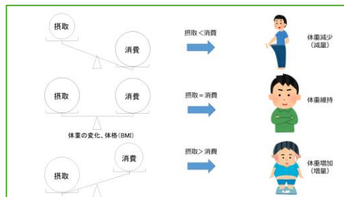
図 食べる量のバランスが体重の増減に関連する

エネルギーとは生命を維持したり（心臓の拍動、体温の維持など）、身体を動かしたり（日常生活、運動・スポーツなど）するときに必要な熱量で、栄養学で使われる一般的な単位は「cal（カロリー）」です。一日に使うエネルギーは「基礎代謝量」「食事誘発性熱産生」「運動による熱産生」に大別され、これを把握することで、一日にどのくらい食べれば良いかがわかります。